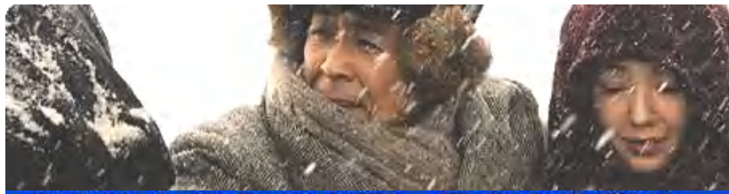
劇映画 いのちの山河～日本の貴空Ⅱ～