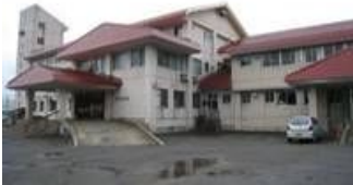
沢内村病院 (現 西和賀町立病院)

後期高齢者医療制度をはじめ、格差社会、ワーキングプア、孤独死、少子化など現代の様々な『いのち』の問題を考えると、いま一度、憲法25条の精神を問い直し、活かしていく必要があるのではないのでしょうか。ひとり一人のいのちを守ることと、平和な社会を実現していくことは、まさに車の両輪なのです。「いのちの山河～日本の青空Ⅱ～」は、山あいの小さな村＝沢内村の人々が、苦難に立ち向かい、憲法25条の精神によって力を合わせ打開していく姿を描くことにより、人間の『いのち』の大切さを訴え、現代から未来への希望を見出せる作品をめざしています。