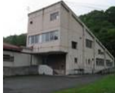
西和賀町医療施設